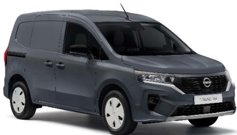
Ciemnoszary – KPW