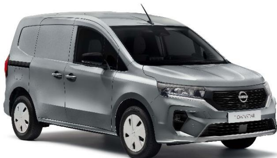
Szary Highland - KQA