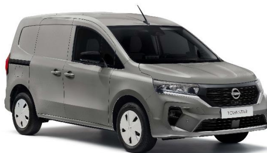
Szary Cassiopeae – KNG