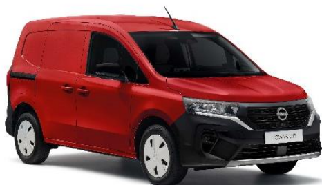
Czerwony - 719

Lakier niemetalizowany – dopłata: 976 zł