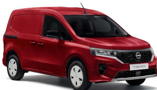
Czerwony Carmin - NPF