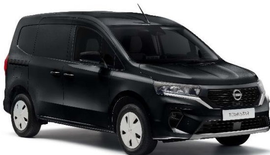
Czarny – GNE