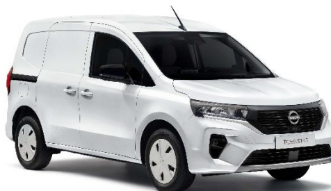
Biały – QNG

Lakier niemetalizowany – dopłata: 976 zł